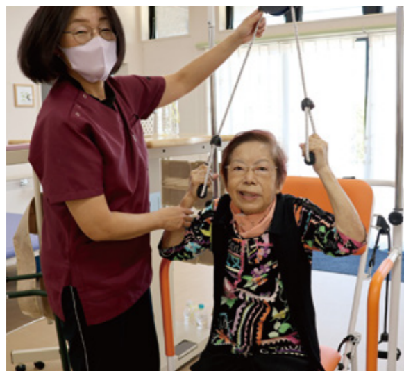
「元氣な笑顔を取り戻せました」と満面の笑顔で喜ぶ入所者と松本代表

大分市大字野田426番地2 TEL.097-547-7244 URL https://loyalaid.jp