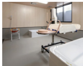
最新の機器を導入し、快適に入浴いただけます