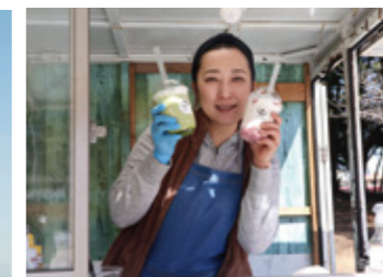
キッチンカーで販売する豆腐スイーツは大分初上陸