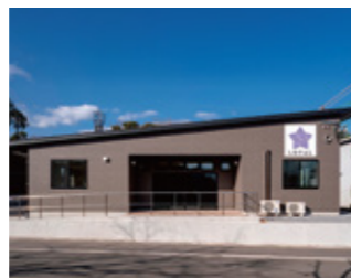
施設の新築には人と環境にやさしいZEBを導入