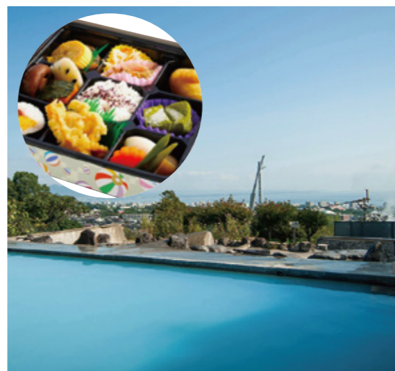
絶好のロケーションに恵まれた温泉と、美味しい手作り弁当が評判のいちのいで会館

URL https://ichinoide-kaikan.jimdofree.com/