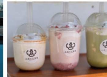
豆腐をドリンクにしたヘルシーなスイーツ