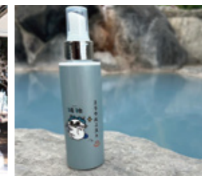
温泉水を使った化粧水「ミラルクミスト」